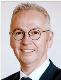
Landrat Rainer Guth Vorsitzender des Verwaltungsrates