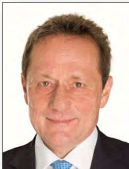
Landrat Achim Schwickert Stv. Verbandsvorsitzender