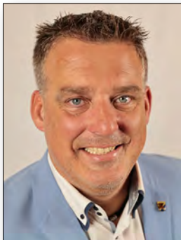
Landrat Volker Knörr 1. stv. Vorsitzender des Verwaltungsrates