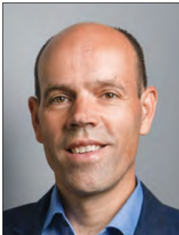
Landrat Volker Boch Vorsitzender des Verwaltungsrates