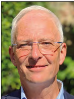
Oberbürgermeister Wolfram Leibe Stv. Vorsitzender des Verwaltungsrates