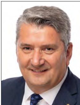
Landrat Miroslaw Kowalski Vorsitzender des Verwaltungsrates