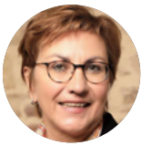
Iris Hotfilter Sparkassenakademie Nordrhein-Westfalen

0231 22240-789 barbara.doerr-lappe@ska.nrw