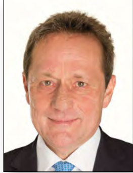
Landrat Achim Schwickert Stv. Verbandsvorsitzender