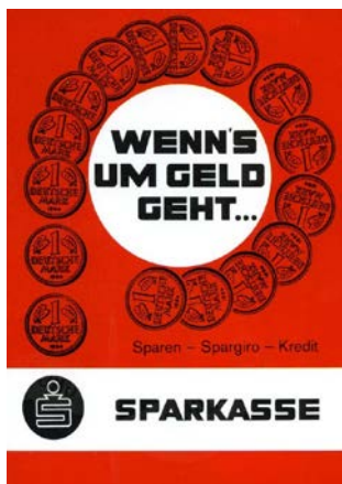
Plakat mit dem Slogan „Wenn's um Geld geht ...“, 1965