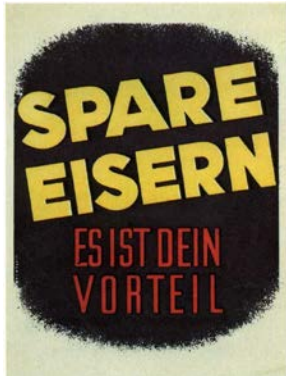
Werbung für das Eiserne Sparen, 1940er-Jahre