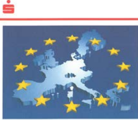
Kundenbroschüre zum Euro, 1996

Der Euro Chancen und Risiken einer gemeinsamen Währung in Europa