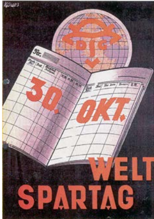
Weltspartagsplakat, um 1930