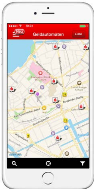
„Filialfinder“-App der Sparkassen